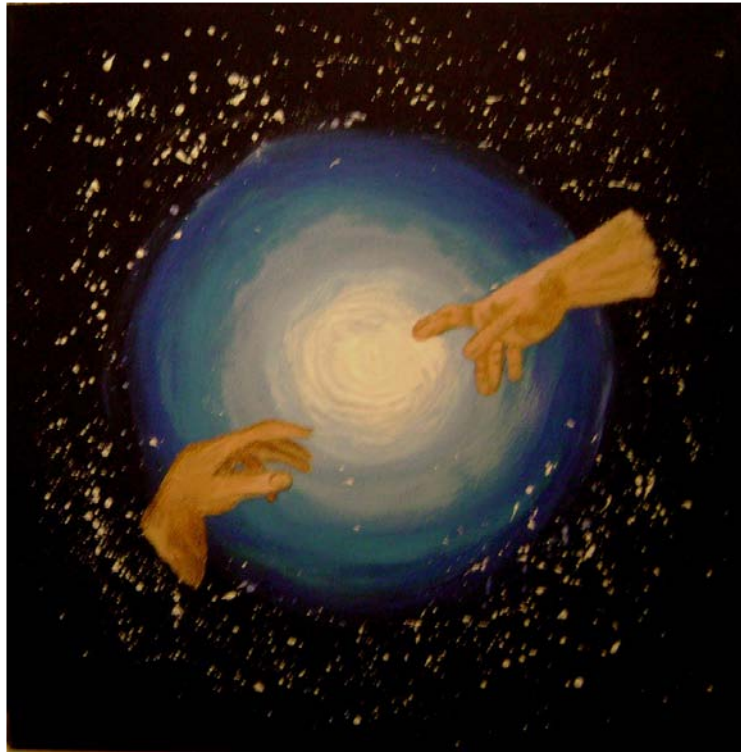
Ursprung des Lebens